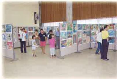
子ども芸術祭・美術展