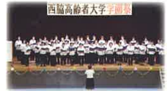
西脇高齢者大学学園祭