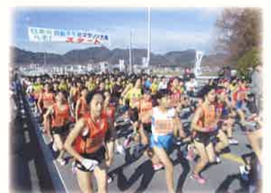
日本のへそ西脇予線マラソン大会