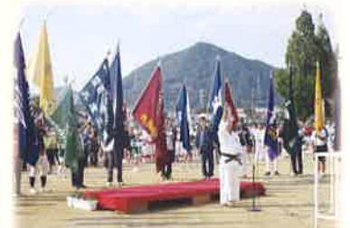
西脇市民体育大会総合開会式