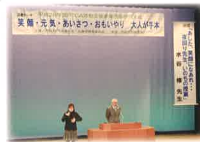
PTCA西脇研究大会(家庭教育の啓発)