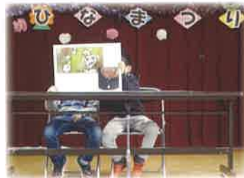
ふれあい交流及び共同学習(ひなまつり会)