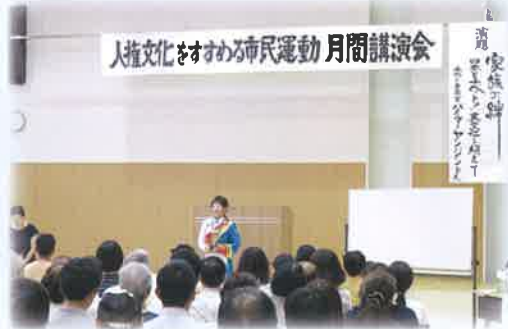
人権文化をすすめる市民運動 月間講演