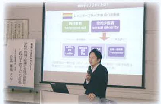
市民じんけんセミナー