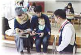
10カ月児乳児相談時のブックスタート訪問