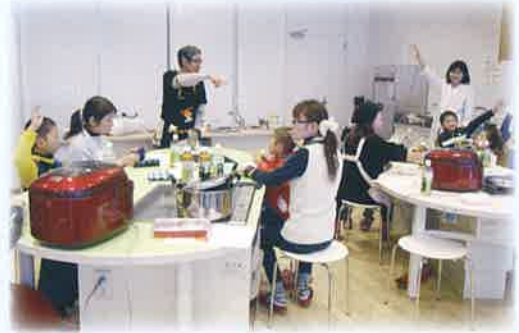
にしわきっ子じんけん教室(さつまいも料理)