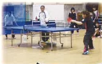
西村卓二杯卓球選手権