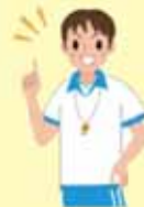
運動の専門指導員