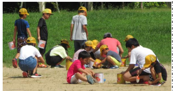
毎週水曜日、全校生で運動場の草引きをしています。

これからもごみのない学校、美しい学校をめざして、みんなが気持ちよく過ごせるよう取り組んでいきます。