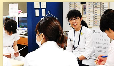
病棟での多職種による乳腺カンファ