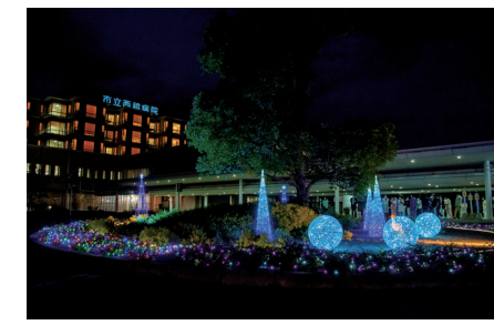
点灯は1月末まで(午後5時～9時)

イルミネーション点灯 入院患者さんやご家族、病院を支える地域の皆さんの心を癒やし、和やかなひとときを過ごしてもらおうと、病院ロビーでイルミネーションを点灯しています。 ▼問合せ 経営管理課(病院内線362)