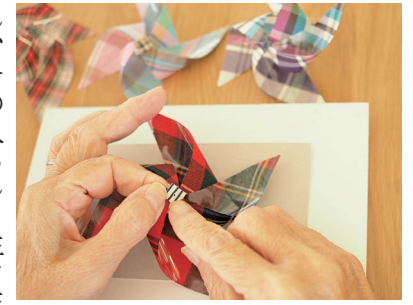
リハビリに播州織生地で風車制作

ひだまりサロン 十分な感染予防対策で実施 12月21日(水) 午後1時 ▼ところ 病院講堂/コロナ感染拡大の状況でインターネット開催のみの可能性あり ▼対象 がん体験者とその家族 ▼内容 交流会とミニ講座 「つらさを和らげてあなたらしく過ごす」がんの療養と緩和ケア ▼申込み・問合せ がん相談支援センター(病院内線331) tiki@nshp.jp