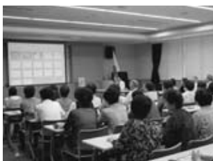
▲健康セミナーの様子