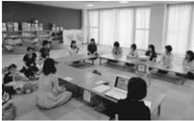
▲柏原のメンバーとの交流会

6月22日、私たちの活動の先輩でもある『県立柏原病院の小児科を守る会』と初めての交流会を行い、お互いの活動報告や、会に対する思いなどを話し合いました。