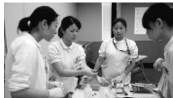
これらを見て、看護局の理念である「一人一人を大切に、信頼される看護」これらを大

4月に新採用者を受け入れて、そろそろ2カ月目になります。そこで、今回は新採用者の受け入れと現況について紹介したいと思います。 毎年、それぞれの部署では新採用者を受け入れるための準備に力を入れています。入職後9日間は集合研修で病院組織についての理解、安全に看護を実践するために必要な講義、電子カルテの基礎と操作研修、看護技術などです。 この集合研修の運営は、看護局だけでなく全職員の協力を得て実施しています。この研修の期間に新採用者同士の関係や先輩看護師との関係づくりができて、緊張した表情から笑顔に変わります。私たちは、「人を思いやる温かい気持ちと創造性をもって、地域医療を担う一人として、誇りを持って働いている」ことを伝え、看護局の理念である「一人一人を大切に、信頼され、安心される看護」これらを大