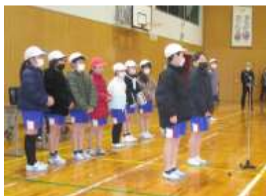
各学年のめあて発表

「来年は195回跳びます!」と早速来年の目標を話しかけてくれた児童がいました。もう前を向いて歩み始めている姿は一段と力強くなっていて、とても嬉しく思いました。