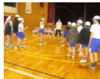
高速跳びに挑戦した6年生