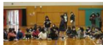
六年生のプレゼン資料

2学期から考え、保護者の皆様にもご協力いただいた家庭学習の取組に関する総仕上げとして、各学級で家庭学習について話し合い、児童朝会においても全校生で交流しました。「面倒だからやりたくない。」「国語と算数以外ってどんなことをすればいいの?」「みんなは分からない時、どうしているの?」「ゲームの方が面白い。」など様々な意見が出て、悩みには高学年が回答しました。そして、最後に教師の考えを伝えた際、児童はとても真剣に聞き、有意義な時間となりました。