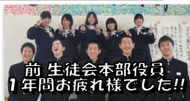
前 生徒会本部役員 1年間お疲れ様でした!!

1年間、最高学年として生徒会を支えてきた3年生は、「躍進～To the Top～」の目標のもと、日々の学校生活や行事において多くの頑張りを見せてくれました。ともに歩んできた仲間との時間を大切にしながら、互いに励ましあい、卒業までの日を充実したものにしてほしいと思います。