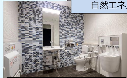
バリアフリースイレ

ユニバーサルデザインや自然エネルギーの利用に配慮した計画により、誰もが利用しやすい施設を実現