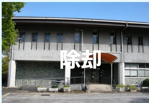
1 勤労福祉センター