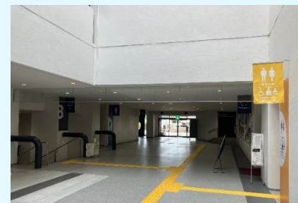
総合市民センター改修