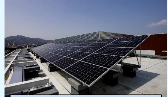
自然エネルギー利用