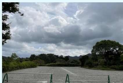
跡地を駐車場等として活用