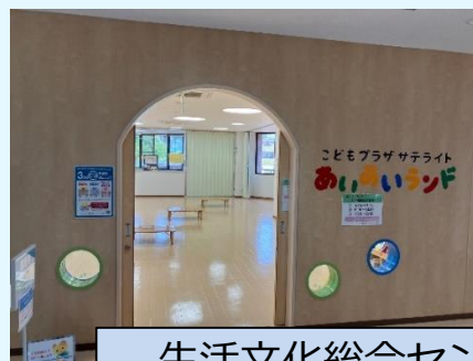
生活文化総合センター（ドウジウム）改修