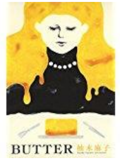
『BUTTER』 柚木 麻子