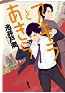
『アキラとあきら』(文庫) 池井戸 潤