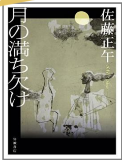
『月の満ち欠け』 佐藤 正午