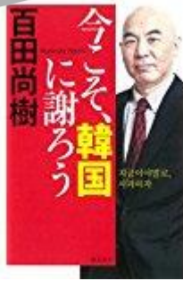
『今こそ、韓国に謝ろう』 百田 尚樹