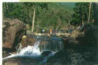
西光寺山の自然の恵み、清らかな水の流れの中での水遊びは最高。