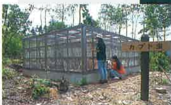
カブト虫養殖ケージ