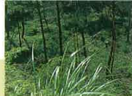
西光寺山登山道は緑のシャワー