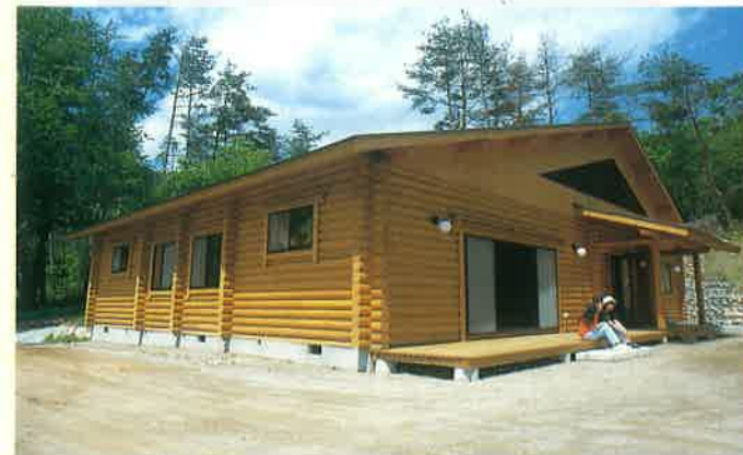
管理棟兼実習用建物