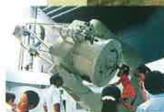
地球と経緯度をテーマとする「日本のへそ」ならではのしわざ経緯度地球科学館。国内最大級の81cm大型反射望遠鏡で、日本のへそから宇宙をのぞいてみませんか。