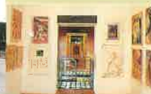
三輪連結の列車をモチーフにギリシャ神殿を想わせる円柱に支えられた岡之山美術館。西脇市出身の世界的なアーティスト、横尾忠則氏の作品を常設展示しています。