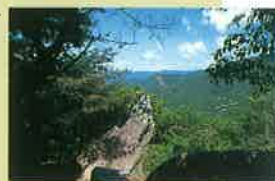
西光寺山の中畑の奇岩、こぐり岩